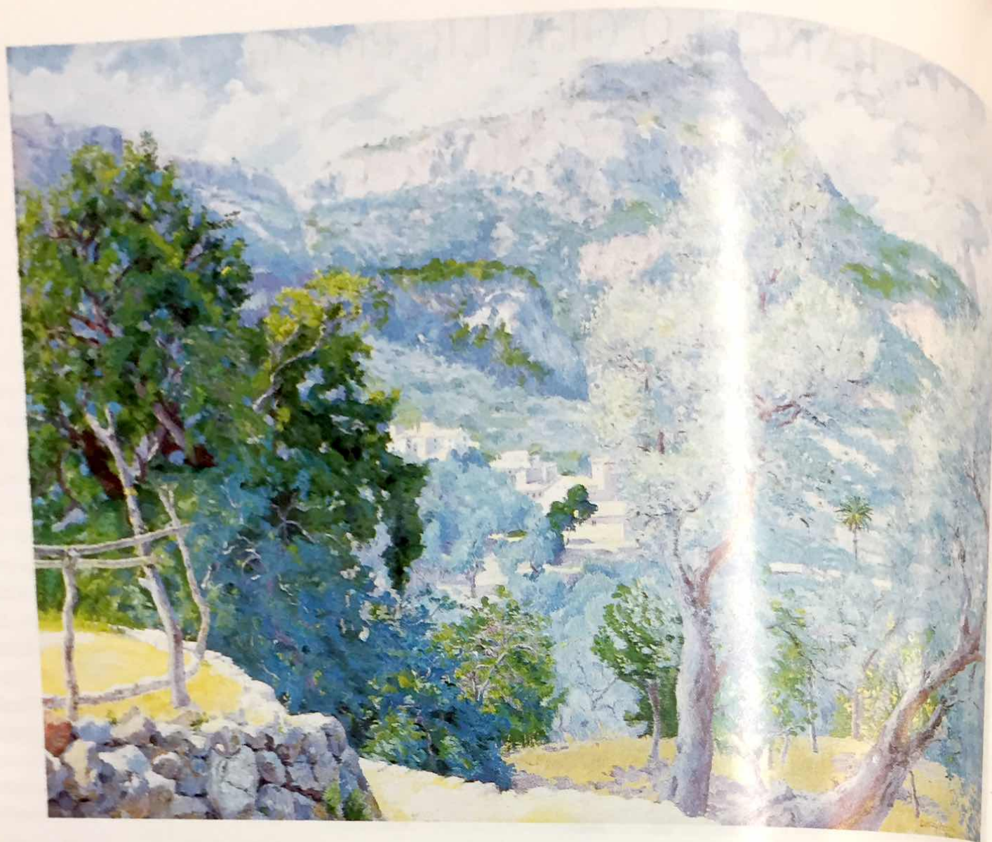
Estellencs 1920 Oli/tela, 73 x 100 Col. AP