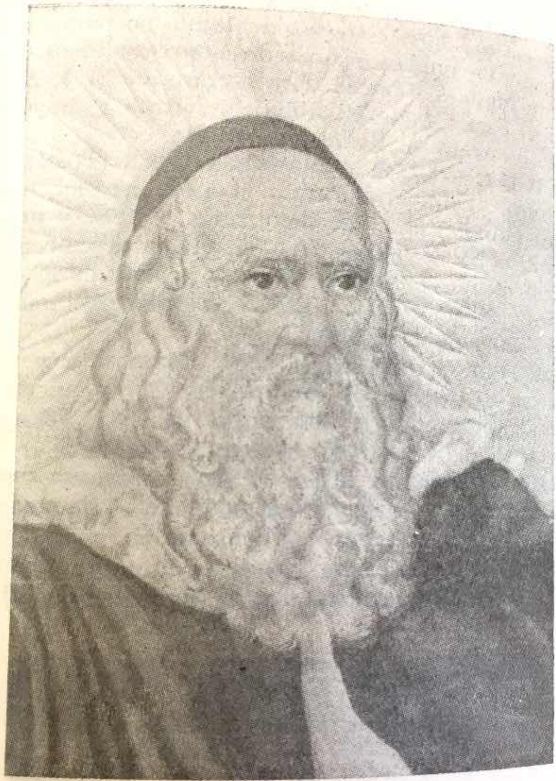
Ramón Lull, por Pedro Barceló

ad I, ri- ragoza y el segundo premio en una Regional de Balea- res, alcanzando éxitos en exposiciones particulares en su país y Barcelona, consiguiendo destacarse como re- tratista de gran vida y expresión, de lo que son prueba